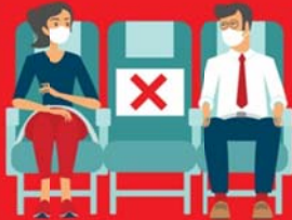
สายการบิน