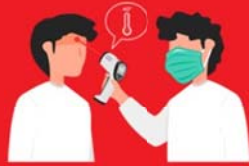
วัดไข้ผู้เดินทาง