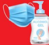
แจกแมส, เจล