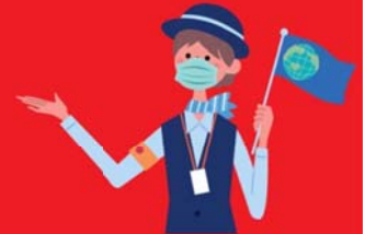
โกดิสแมสตลอดเวลา