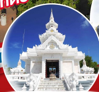
ศาลหลักเมืองนครศรีธรรมราช

ไฟล์ทสวย ชินสาร์ - อากิตย ไม่ต้องลังาน เพียง 12 ท่าน ออกเดินทาง โดยเครื่องบิน