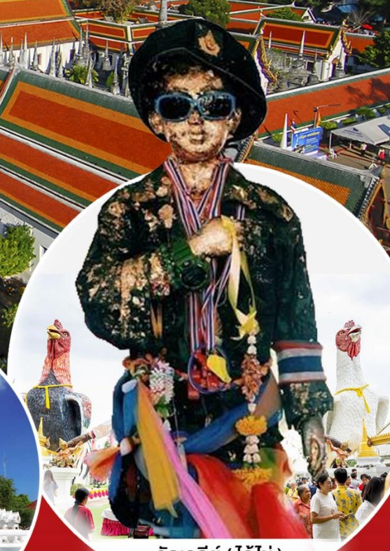
วัดเจดีย์ (ไอ้ไข่)