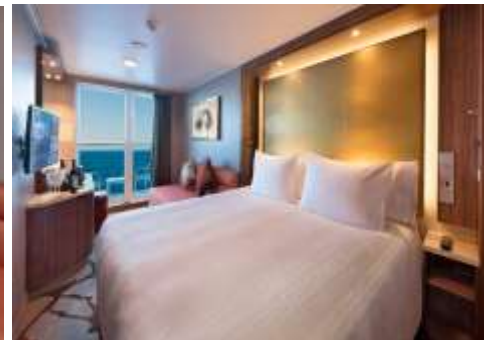
ห้องพักแบบมีระเบียง