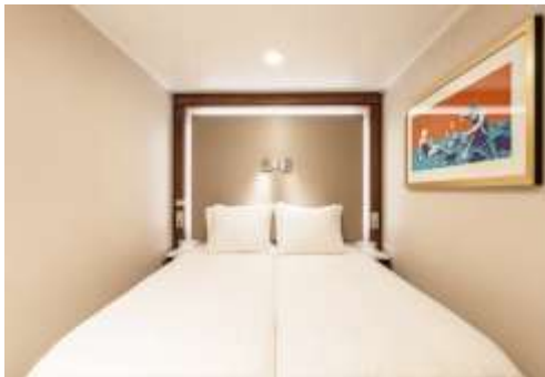
ห้องพักแบบไม่มีหน้าต่าง

**ขอสงวนสิทธิ์ในการเปลี่ยนแปลงเงื่อนไขและราคา โดยไม่แจ้งให้ทราบล่วงหน้า