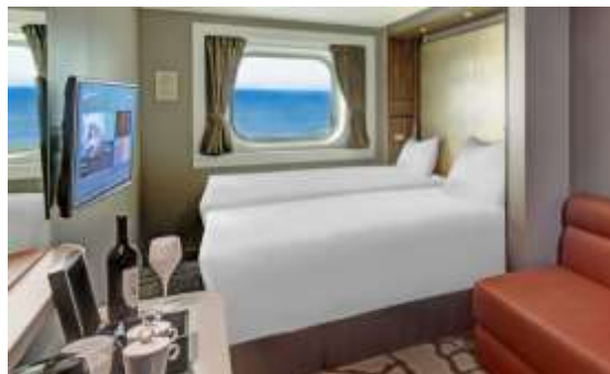
ห้องพักแบบมีหน้าต่าง