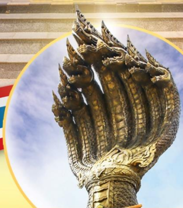
พระยาศรีสัตตนาคราช