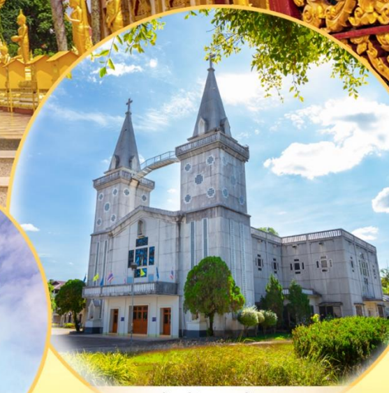
วัดนักบุญอันนา