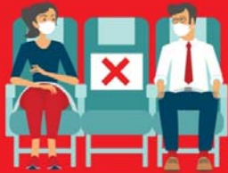
สายการบิน