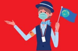
ไกด์ใส่แมสตลอดเวลา