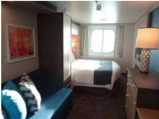
Ocean view stateroom

***ตรวจสอบห้องพักกับเจ้าหน้าที่ทุกครั้งก่อนทำการจอง ห้องมีจำนวนจำกัด***